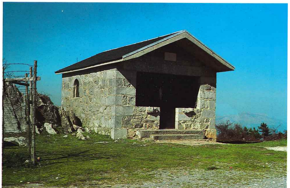
Ntra. Sra. de la Paz

Observaciones: Ermita reciente, construida en 1974.