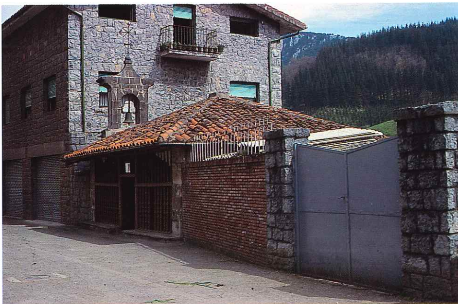
Ntra. Sra. de la Piedad