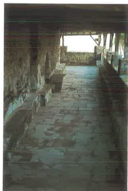
San Pelayo 1. Puerta. 2. Pórtico.