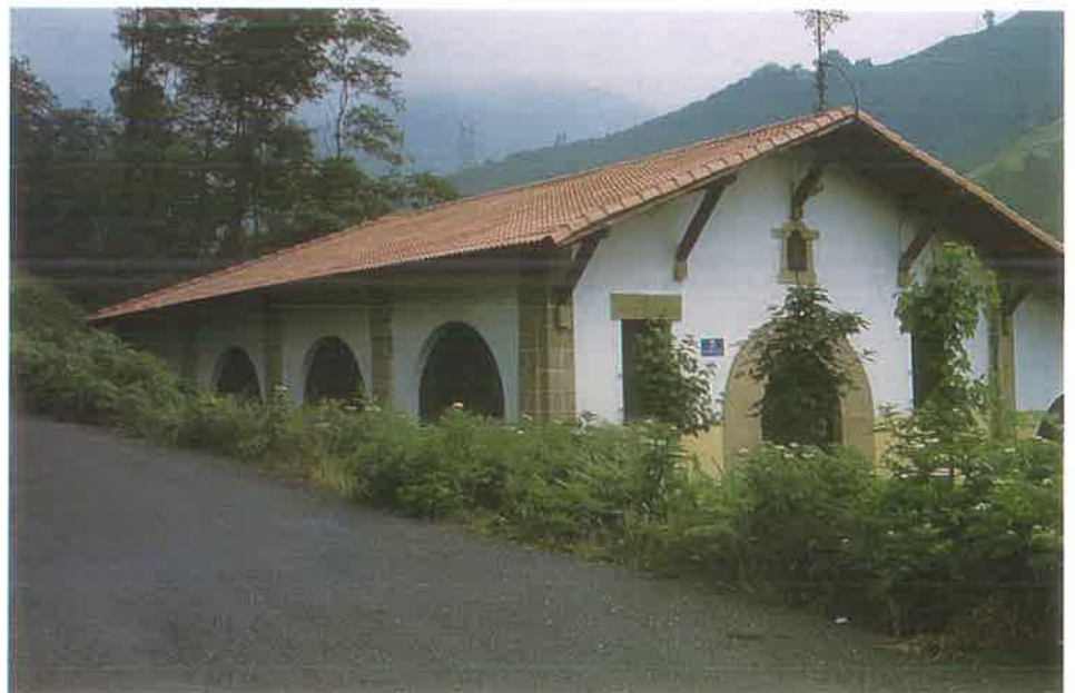
Ntra. Sra. de la Guía

Observaciones: La ermita fue construida por D. Gonzalo de la Rica.