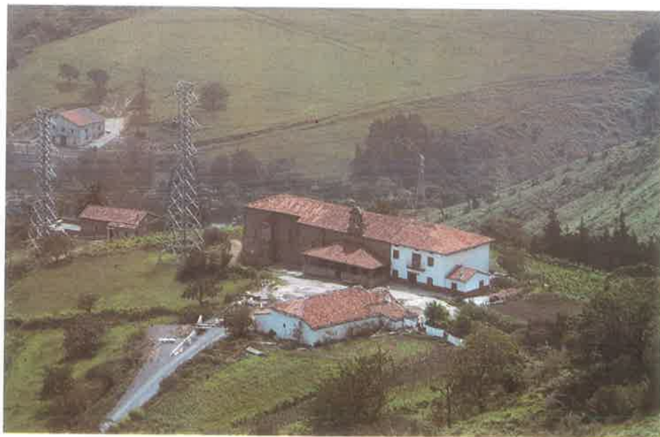
Santa Agueda Emplazamiento.

Enterramientos: En una de las reparaciones de la ermita, se encontraron restos humanos en el interior de la misma. Este lugar está señalado con una cruz.