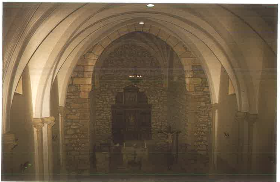
San Antolín de Irauregi Interior.

Capellanía: En el Archivo de la Catedral de Sto. Domingo de la Calzada se conserva, según A. Rodríguez, un expediente del año 1632, en el que figura la posesión de la Capellanía de San Antolín de Irauregui «que está en la anteiglesia de Baracaldo, y que fundó Antón Pérez de Coscojales, vecino de la villa de Portugalete, ya difunto».