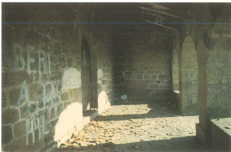
Santa Cruz de Bizkargi Pórtico.

Es considerada como perteneciente a los municipios de Gorozika, Etxano-Amorebieta, Muxika y Morga.