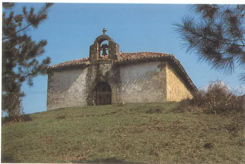
San Antolín de Epaltza

Observaciones: Labayru menciona un San Pedro en Epaltza. Parece que se trata de la misma ermita ya que en ella se venera una imagen de San Pedro. Sobre la advocación y fiesta de San Antolín señala el mismo autor: