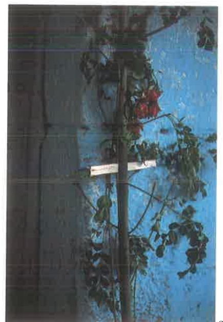
San Juan Bautista de Solaguren