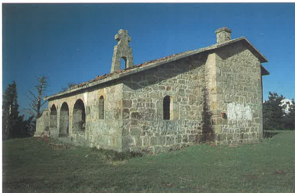
Santa Cruz de Bizkargi