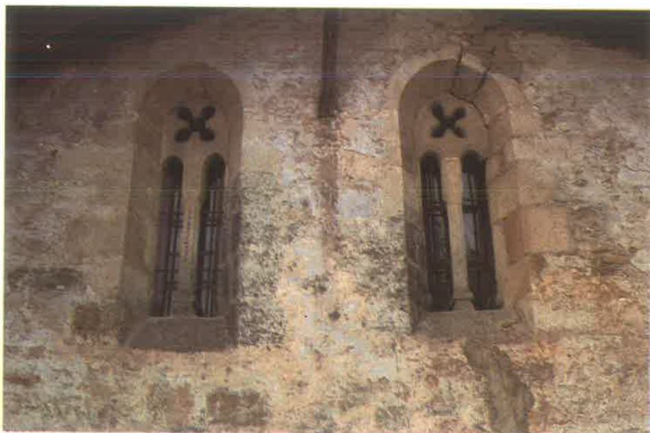
San Román Ventanas.

«Se trata de dos ejemplares raros en la geografía artística del País. Aunque su catalogación siempre se prestará a opiniones diversas dado su carácter popularísimo, hay que estudiarlas dentro del arte románico, pues los vanos y la ermita en general tienen un aire inconfundible de tal estética, aunque sea en versión popular. Es una pervivencia estética del románico en avanzado siglo XIII...»