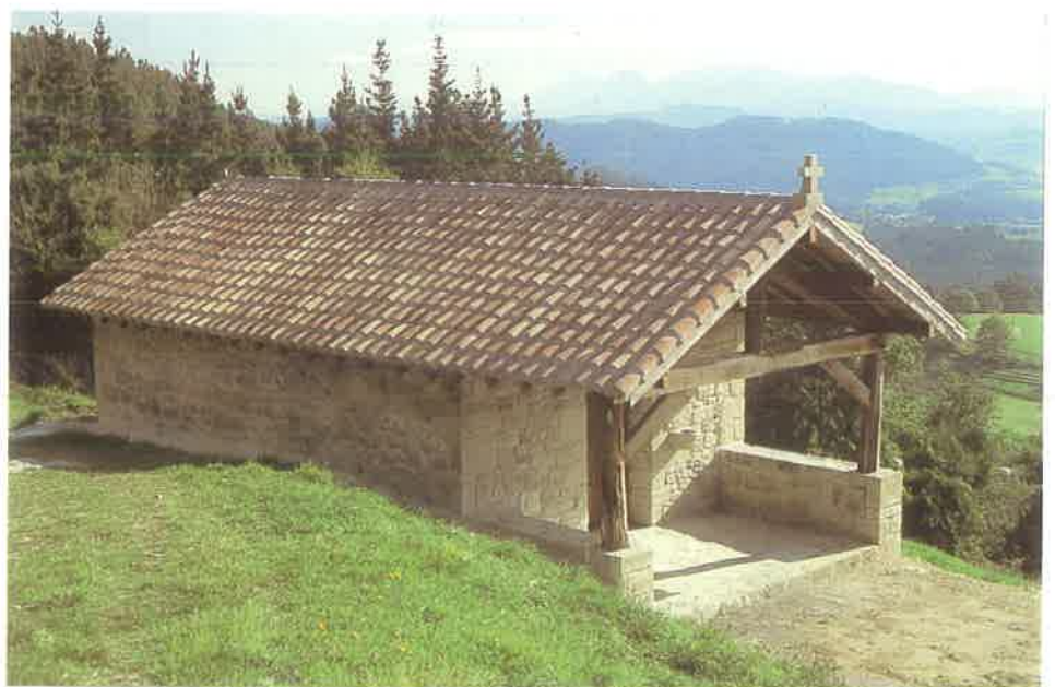
San Miguel de Daños

Enterramientos: Hay tradición de antiguos enterramientos.