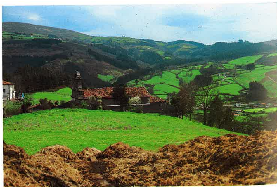
Ntra. Sra. de la Caridad Emplazamiento.

Adosada a la ermita han construido una sala de reunión para uso del vecindario.