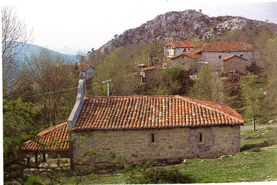
Virgen de la Trinidad

La campana tiene la inscripción: Virgen de la Trinidad / Trucios / 1949.